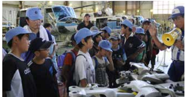
【科学体験バスツアー】

宇都宮市内の小学校に従業員が出向き、地球温暖化の仕組みについて説明や実験を実施、環境問題への理解を深めてもらう活動を行っています。主に小学校5年生を対象に、2006年度から開始し、2012年度は48クラス(1,483名)を実施しました。(累計で220クラス、7,031名)