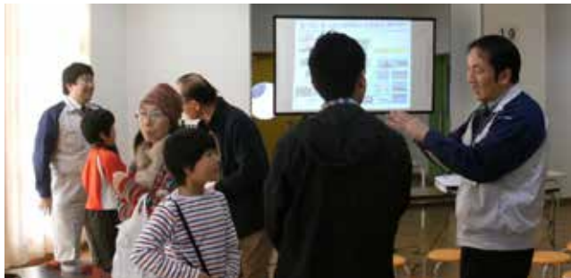
【半田市セカンドライフ フェスティバル】

宇都宮市主催による、市内の小学校・中学校の生徒・保護者を対象とした工場見学会を実施しました。次世代を担う小・中学生に、ものづくりや科学への関心を高めてもらうことを目的に、2007年から子どもたちの夏休み期間に合わせて実施しており、今年度は約90名が参加。質疑も多数寄せられ、航空機への関心の高さを感じることができました。