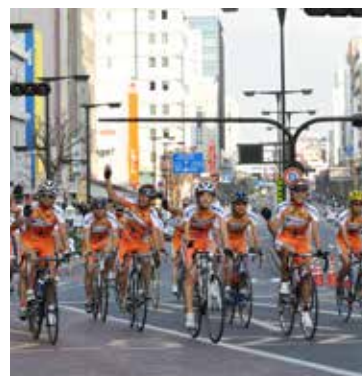
【JAPAN CUPサイクルロードレース】

8月、「納涼盆踊り大会」が、地域自治会・婦人会・子供会、協力企業の皆様など約3,000人の参加を得て、盛大に行われました。盆踊りは1984年から実施しており、地域貢献の大きな行事となっています。