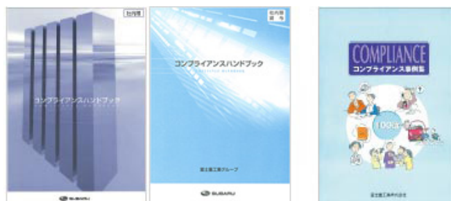
左：関係会社向けコンプライアンスハンドブック 右：コンプライアンス事例集100選

また、当社では、コンプライアンスの日々実践を推進するため、当社のみならず、関係会社や国内スバル販売特約店に特化したものも含め、さまざまな支援ツールを作成・提供しています。加えて、緊急度の高い情報については「コンプライアンス情報」をタイムリーに配信し、グループ全体の注意喚起に取り組んでいます。