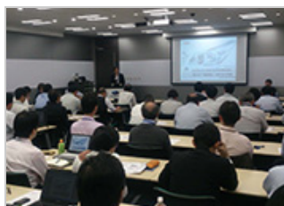
コンプライアンス研修の様子（本社）