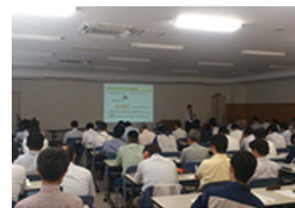
コンプライアンス研修の様子（東京事業所）