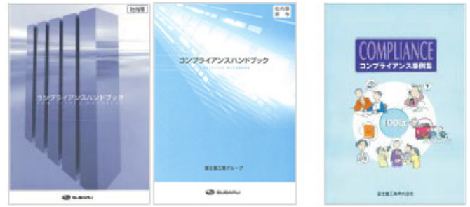
左：関係会社向けコンプライアンスハンドブック 右：コンプライアンス事例集100選

また、当社では、コンプライアンスの日々実践を推進するため、当社のみならず、関係会社や国内スバル販売特約店に特化したものも含め、さまざまな支援ツールを作成・提供しています。加えて、緊急度の高い情報については「コンプライアンス情報」をタイムリーに配信し、グループ全体の注意喚起に取り組んでいます。