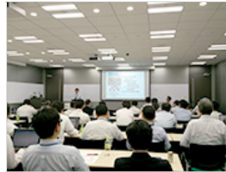
コンプライアンス研修の様子 (本社)