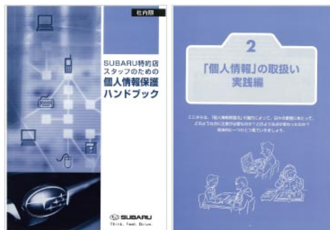
SUBARU特約店スタッフのための個人情報保護ハンドブック

特に国内スバル販売特約店では、お客さまの個人情報を直接かつ大量に取り扱うことから、関係会社を含めた全国44の販売特約店それぞれに体制の整備を徹底しています。また、全販売特約店共通の「SUBARU特約店スタッフのための個人情報保護ハンドブック」を作成・活用し、従業員一人ひとりが個人情報保護に関して正しく理解するよう努めています。