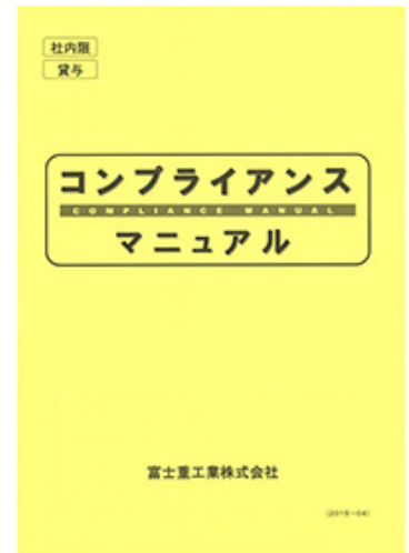
コンプライアンスマニュアル

さらに2015年度には、中国特有の社会事情を考慮した中国版贈賄防止ガイドライン（中文訳付）を制定し、中国子会社に展開、当該各社で規程化を進めています。