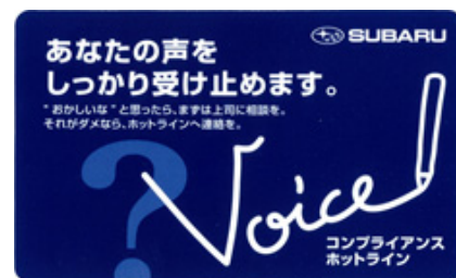
コンプライアンス・ホットラインカード