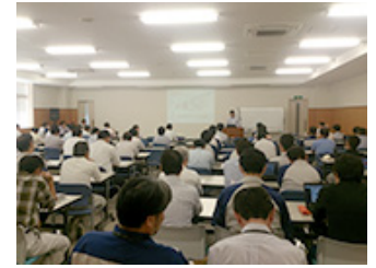
コンプライアンス研修の様子 (東京事業所)